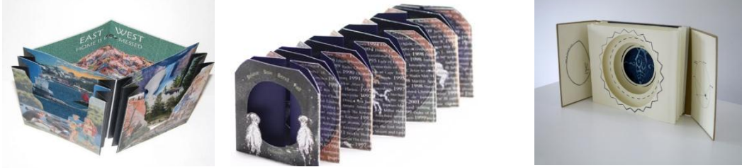
شكل رقم (١) مطوية/ قصص الأنفاق / المسارات

يستخدم مصطلح هندسة الورق لتعريف كتب / قصص المناظر المتحركة، ففي القرن التاسع عشر بدأ الناشرين إنتاج تلك الكتب / القصص لتسليية للأطفال. وأصبحت ذات شعبية كبيرة بين أسر الطبقة العليا.