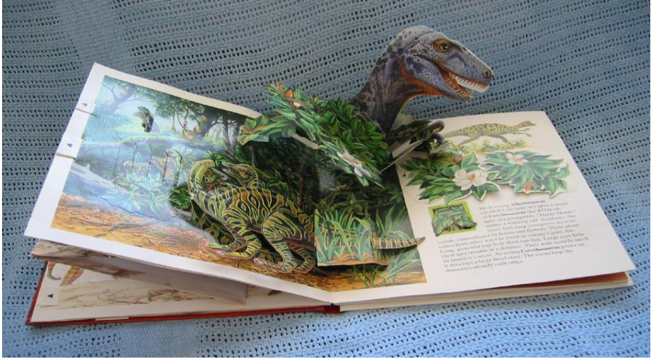
شكل رقم (٢) تحولات المشاهد الموضوعة على شرائح الورق العمودية