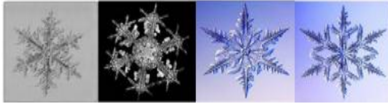
شكل رقم (٢) يوضح التماثل التام (بلورات الثلج)

أقوي أنواع التماثل التام حيث يظهر النظام البنائي لشكل الفراكتال بوضوح كامل وبدقة شديدة على أي مقاييس تكبير وعلى كافة مستويات الرؤية، وتعتبر أشكال الفراكتال المنتجة باستخدام أنظمة التتابع التكرارية ذات تشابه تام ومتطابق ويوضحه شكل رقم (٢) بلورات الثلج.