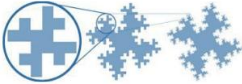
شكل رقم (١) يوضح (التمائل الذاتي)

https://iajadd.journals.ekb.eg/article_223366_77a2ab45f5710a9ed7f0361e808001a9.pdf